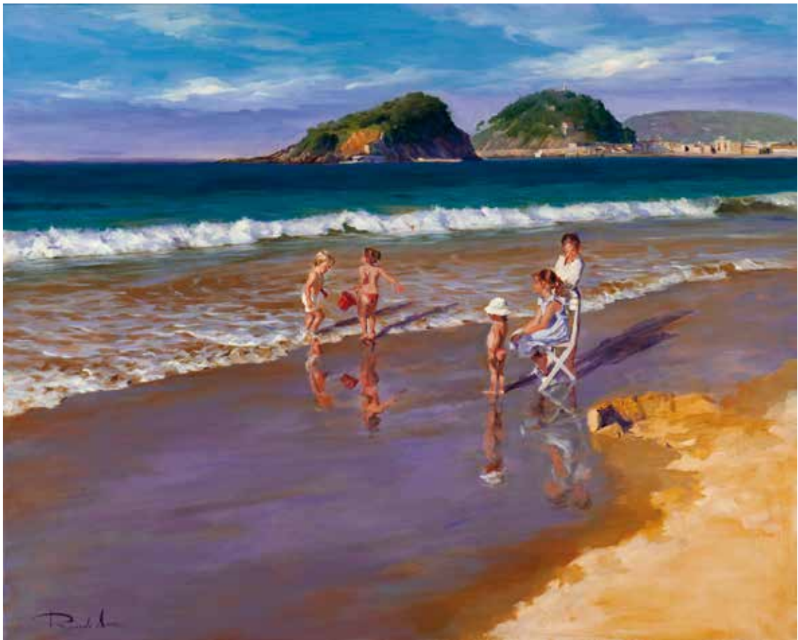
Niños en la playa. 81 X 100 cm