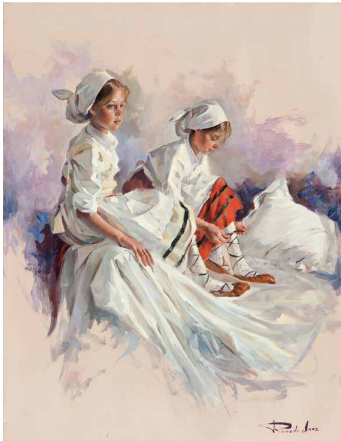
Preparándose para el baile. 65 X 50 cm