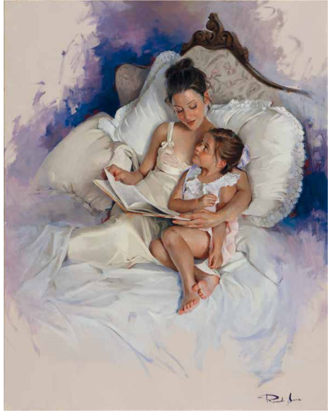
Contando cuentos. 92 X 73 cm