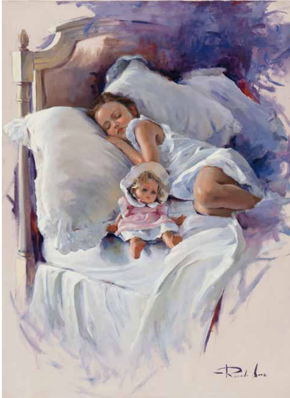
El sueño. 73 X 54 cm