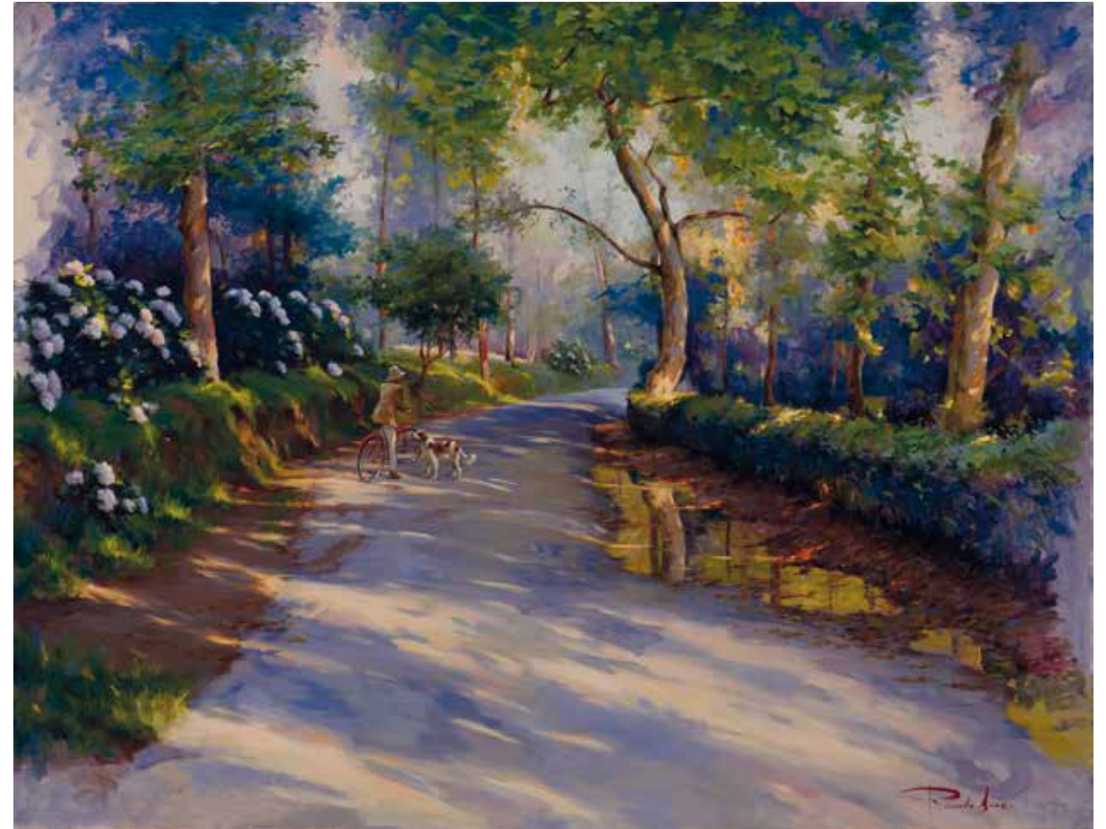
Hortensias en Ulía. 89 X 116 cm