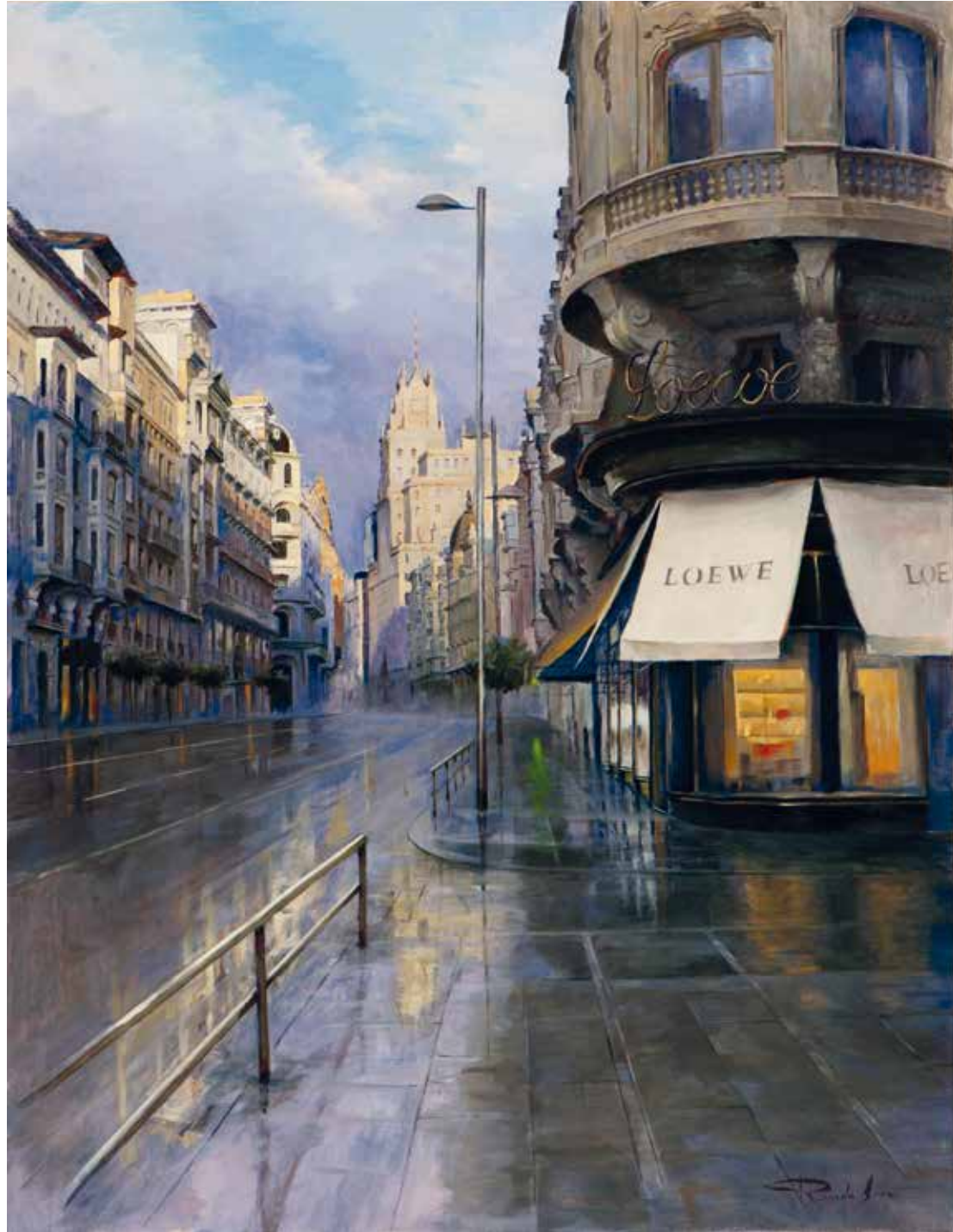
Primeros rayos de sol en la Gran Vía. 116 X 89 cm