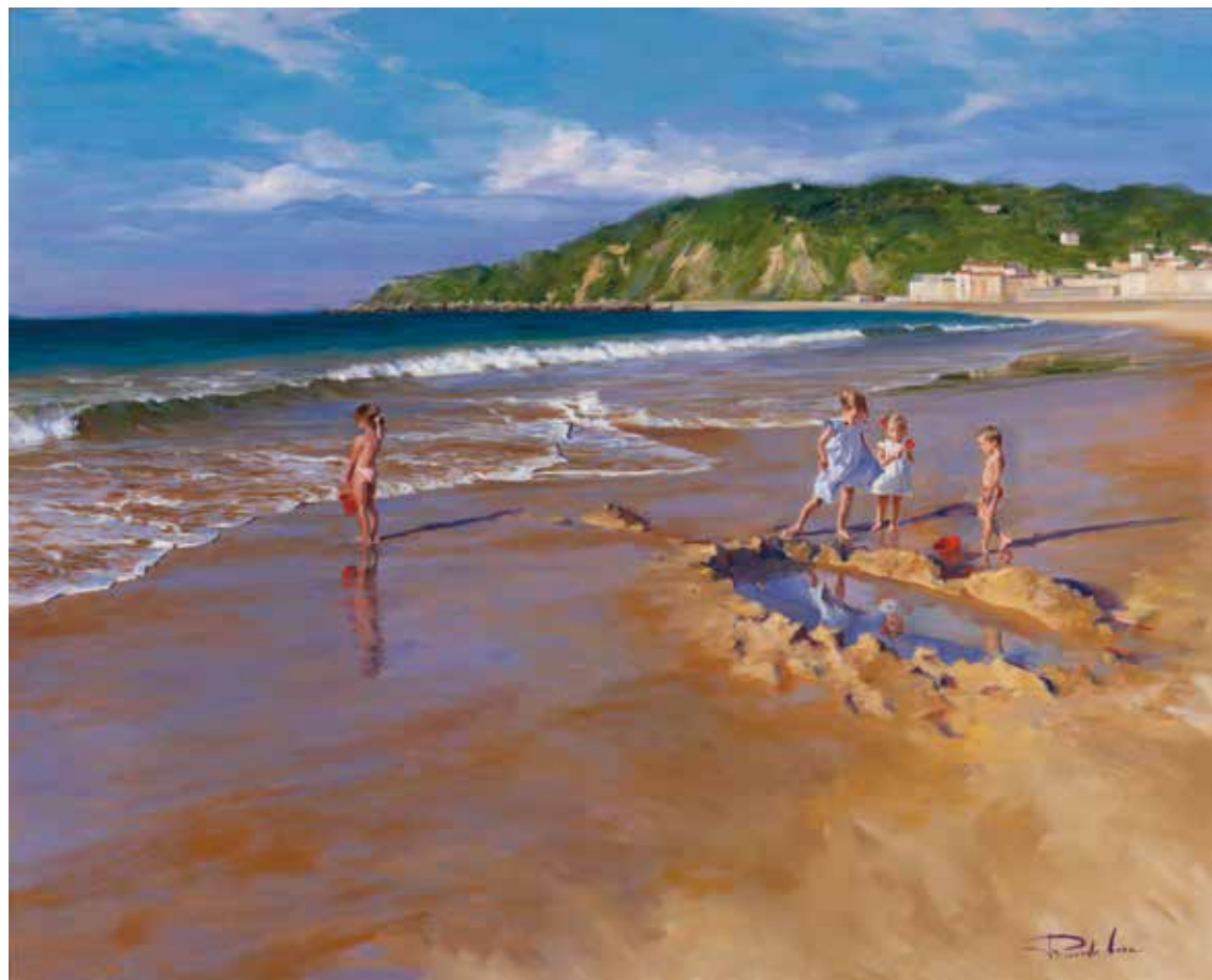
Jugando en la orilla. 81 X 100 cm