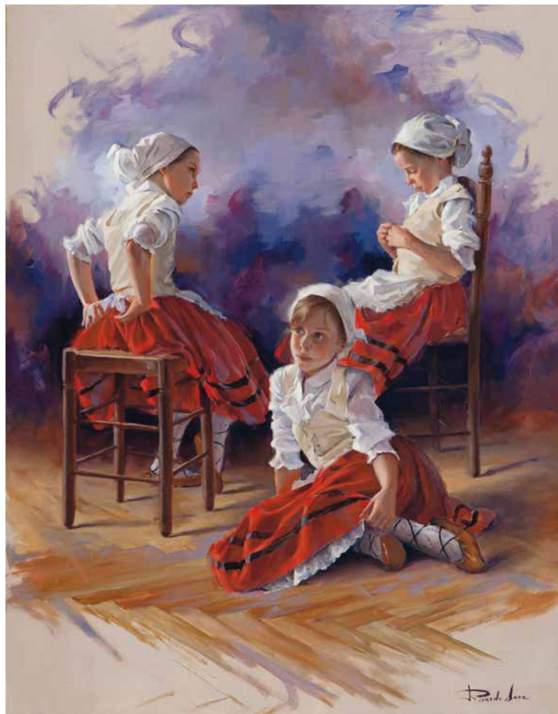
Vestidas de pospoliñas. 92 X 73 cm