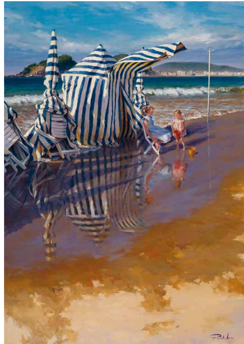
Marea alta en Ondarreta. 162 X 114 cm