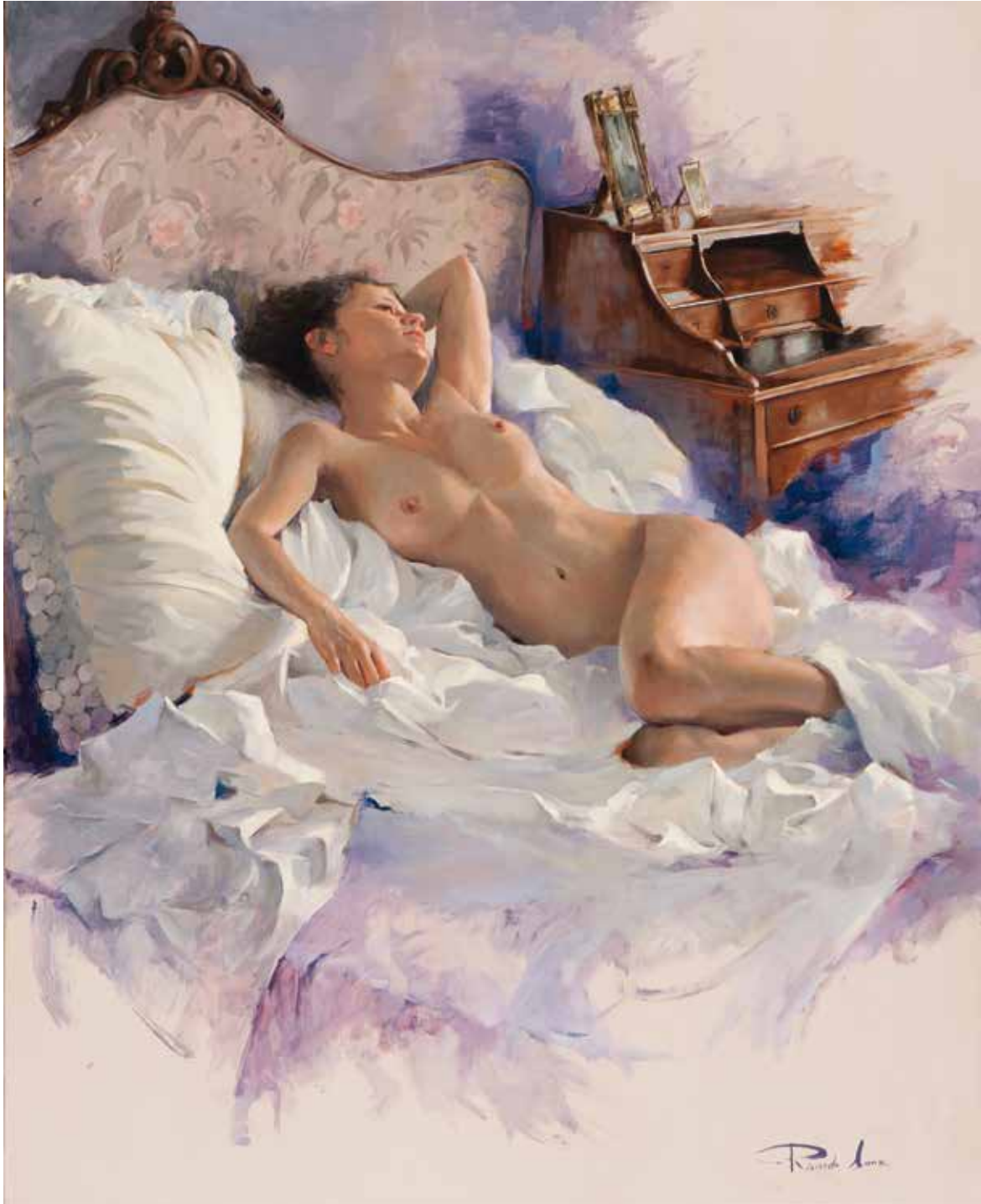
Desnudo entre sábanas. 100 X 81 cm