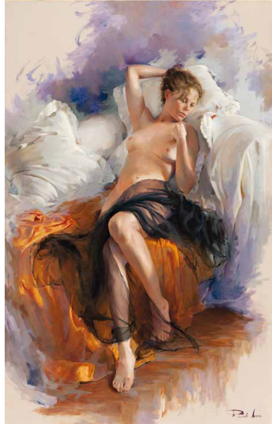
Reposando. 116 X 73 cm