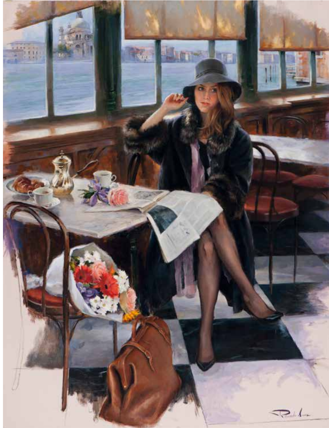
Esperando en el Café. 116 X 89 cm